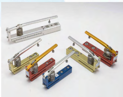
▲打抜きサイズ・形状 オーダー製作